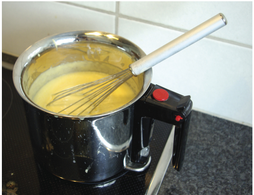
Abb. 1: Sauce Hollandaise im Simmertopf